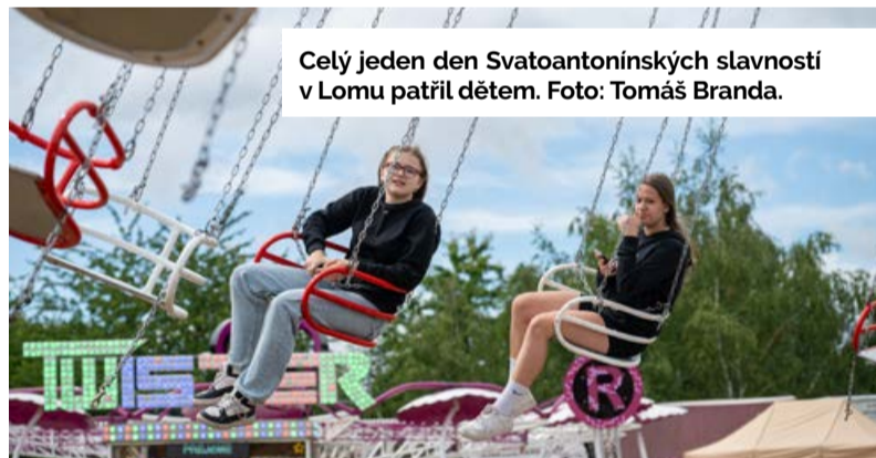
Celý jeden den Svatoantonínských slavností v Lomu patřil dětem.