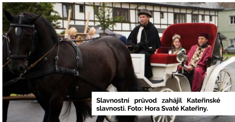
Slavnostní průvod zahájil Kateřinské slavnosti.