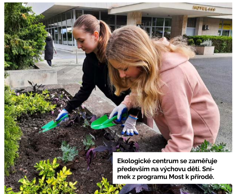
Ekologické centrum se zaměřuje především na výchovu dětí. Snímek z programu Most k přírodě.