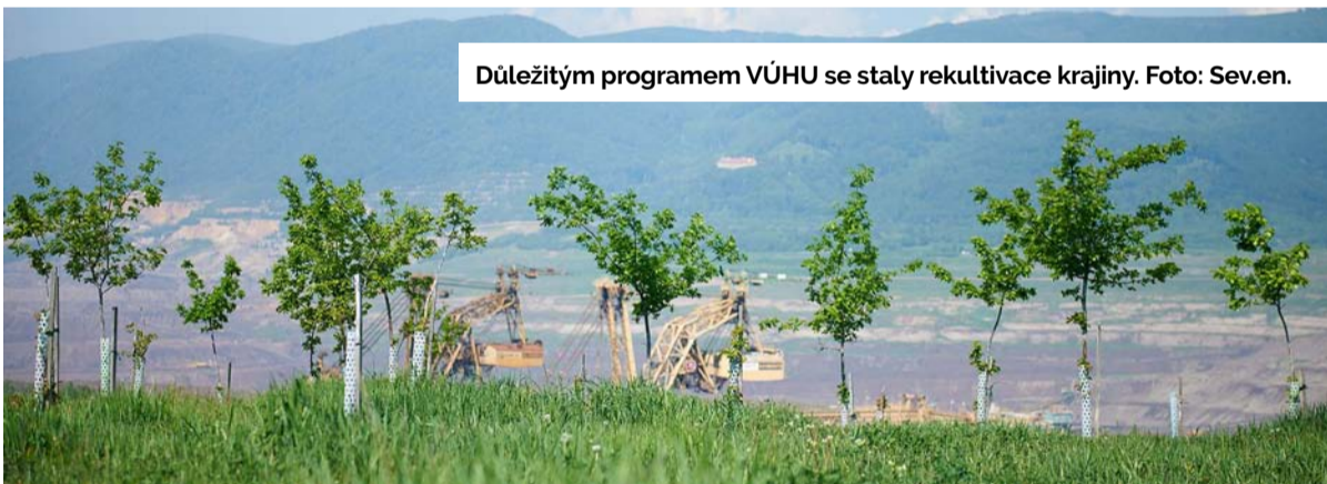
Důležitým programem VÚHU se staly rekultivace krajiny.

užití bývalého lomu. „Výsledky s cíli projektu Green Mine víceméně korespondují. Obyvatelé chtějí farmaření, nová sídla, fotovoltaiku. Méně už akceptují výrobní podniky,“ vysvětluje Renáta Zárubová. Právě ekologická centra v Mostě a Kralupech nad Vltavou považuje ředitelka za „vlajkové lodě“ výzkumného ústavu, jejichž úkolem je šířit pravdivé informace o životním prostředí a vzdělávat nejmladší generace.