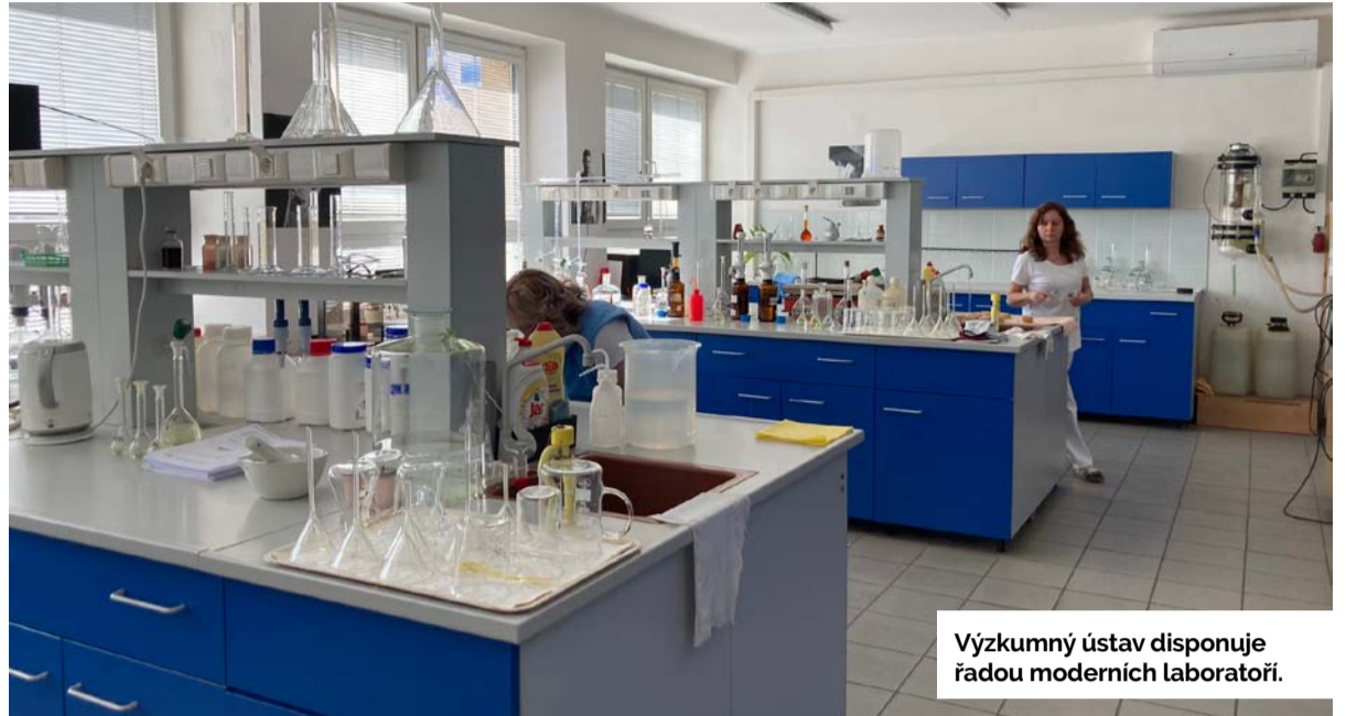
Výzkumný ústav disponuje řadou moderních laboratoří.

Výzkumný ústav se připravuje i na nové výzvy. „V souvislosti s připravovanou těžbou lithia, po kterém je dnes ve světě obrovská poptávka, jsme v laboratoři také akreditovali stanovení lithia, což není úplně snadné,“ říká ředitelka ústavu. Certifikují tu také například produkty po spalování v elektrárnách. „Dříve to byl odpad. V současné době, pokud výrobce splní určité legislativní požadavky, může z toho vzniknout výrobek, který je možné dále využít ve sta-